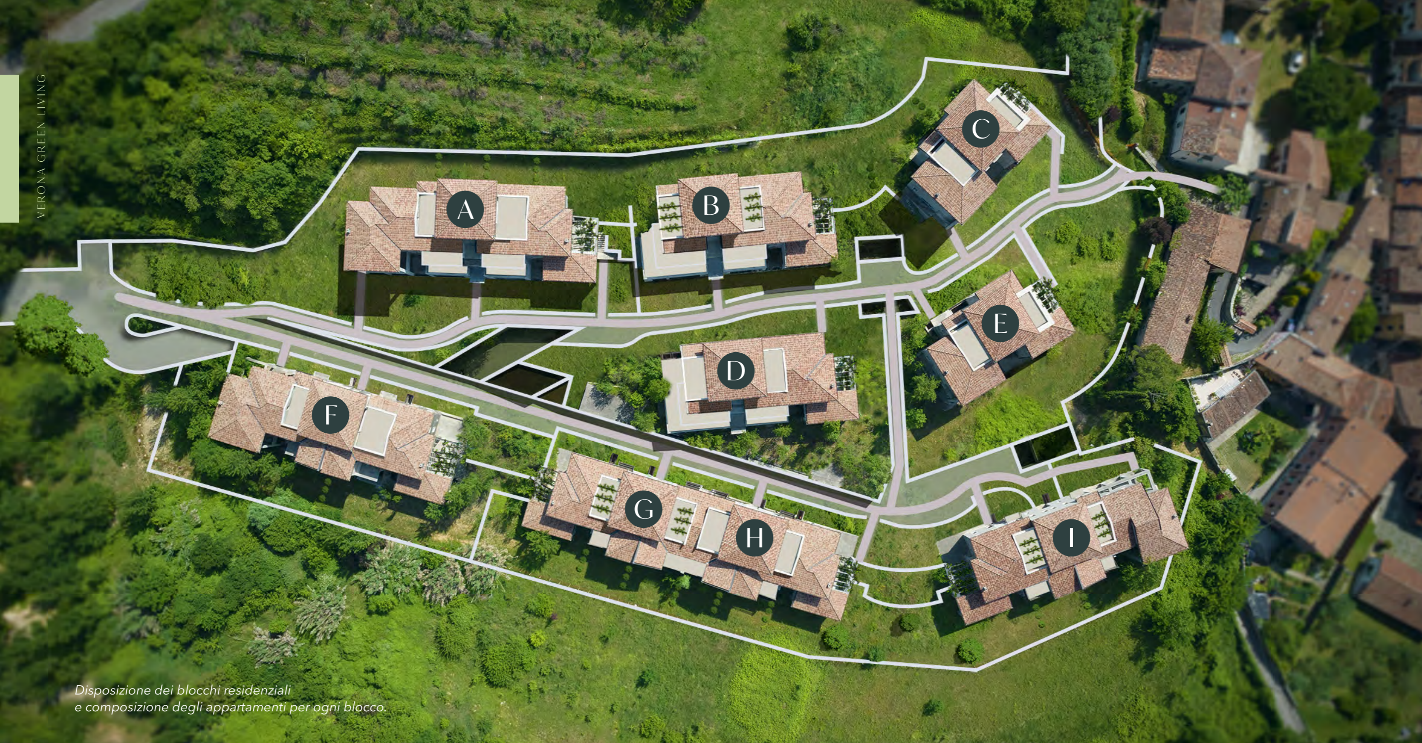
Disposizione dei blocchi residenziali e composizione degli appartamenti per ogni blocco.